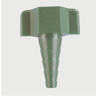
Uniwersalna złączka do wężyka Poz. nr: M4610