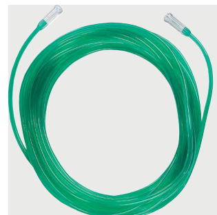
Przedłużacz (wężyk) - kaniula nosowa 4.5m kolor zielony Poz. nr: M4150G