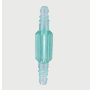
Łącznik drenów Poz. nr: M4650