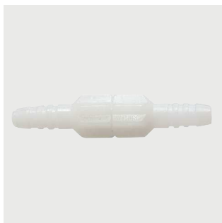
Łącznik obrotowy drenów Poz. nr: M1220