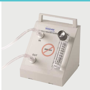
Przepływomierz dziecięcy - 50 do 750 cc/min Poz. nr: 1514913