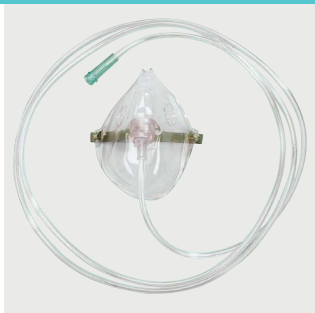
Maska tlenowa dla dorosłych 2.1m Poz. nr: M3210