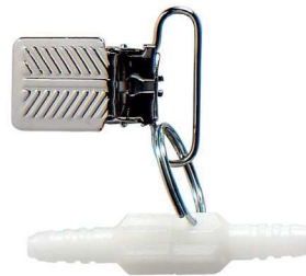
Łącznik obrotowo-zaciskowy drenów Poz. nr: M1221