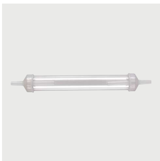
Łącznik kondensacyjny Poz. nr: M1523