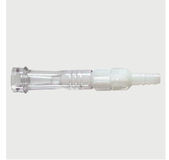
Obrotowy łącznik drenów dla kobiet i mężczyzn Poz. nr.: M1225