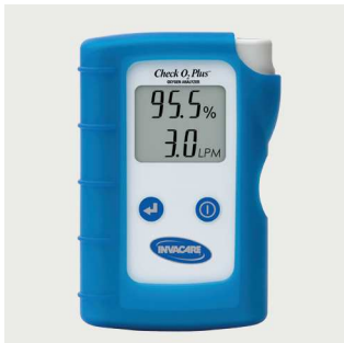
Analizator tlenu Poz. nr: IRC450