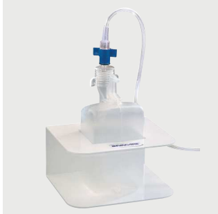
Podstawa na nawilżacz Poz. nr: M1521