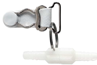
Łącznik obrotowo-zaciskowy drenów Poz. nr: M1222