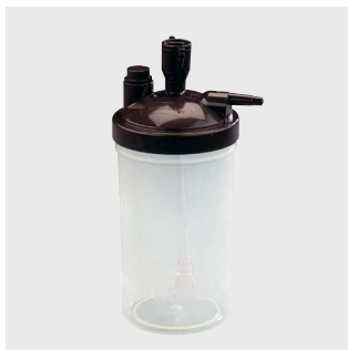
Nawilżacz Platinum® 9 Poz. nr: : 1509582